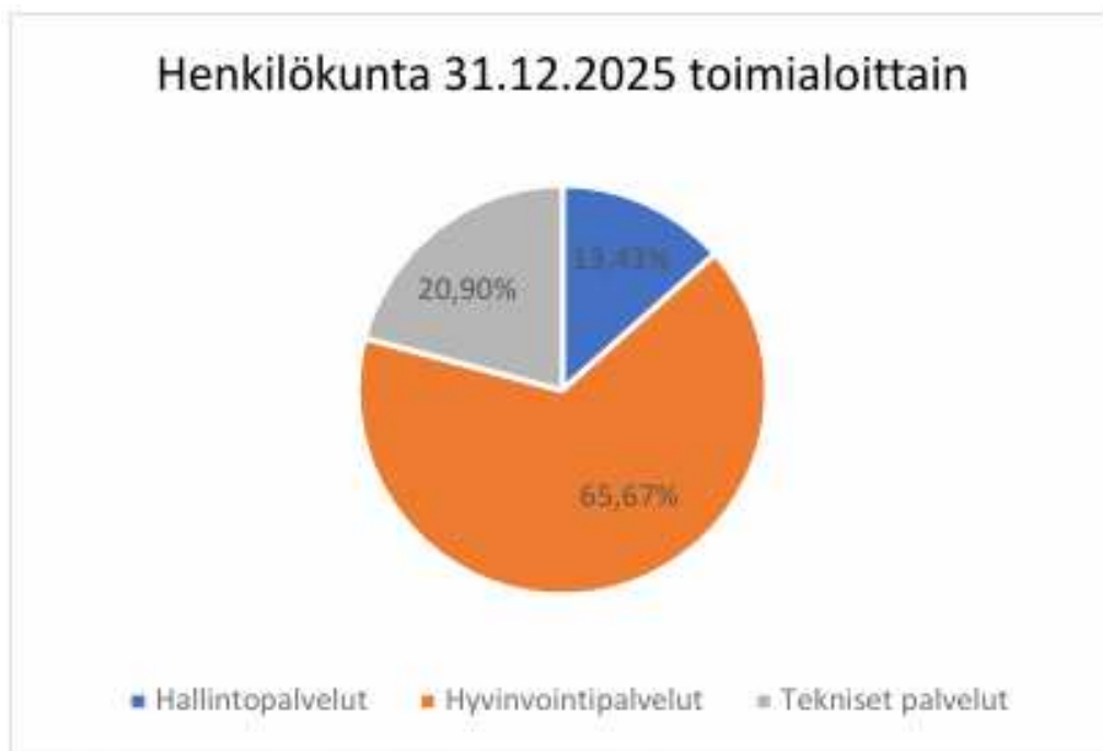
Kuva 1: Henkilökunta 31.12.2025 toimialoittain